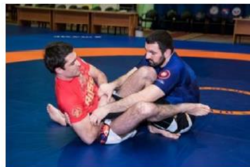
Пример проведения приема, при котором стопа не выпрямлена