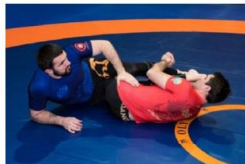
The foot на выпрямленную ногу