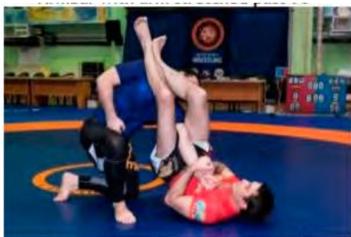
Armbar with arm stretched past 90