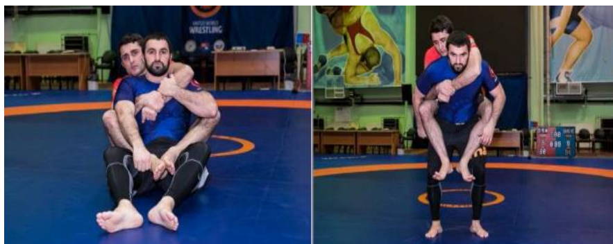
Пример Back Mount позиции (контроль со спины)

Когда грэпплер контролирует соперника со спины его/её грудью к спине соперника и его/её пятками между бёдер соперника, не скрещивая ноги или стопы, имея в ловушке одну из рук соперника, в течении 3 секунд. Только контроль со спины доминирующая позиция может быть установлена в положении стойки и положении снизу