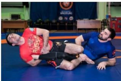
Попытка ущемления ахиллова сухожилия, при которой стопа соперника выпрямлена