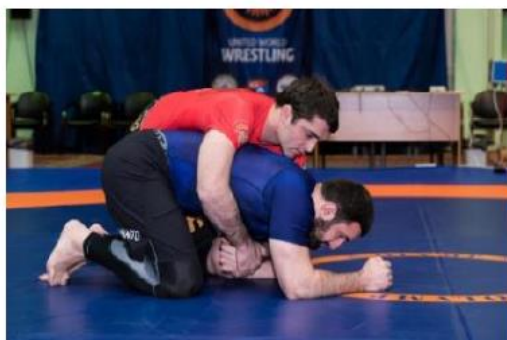
Спортсмены проводят контроль за руками