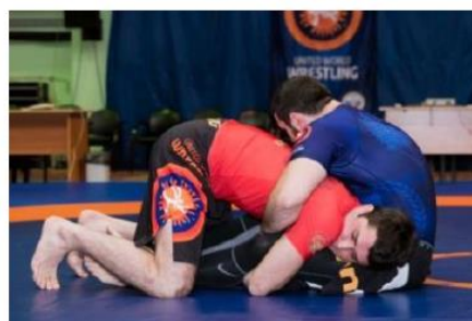
Спина больше 90° от пола