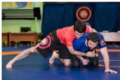
3 точки контакт и контроль между шей и руками