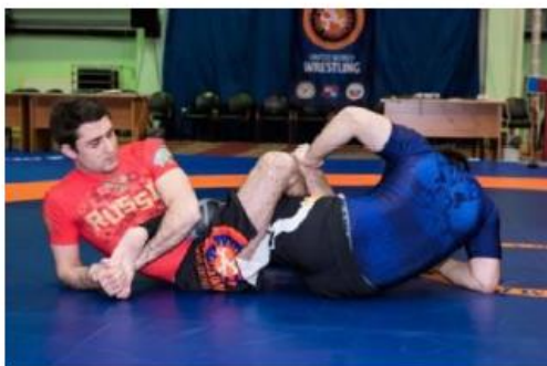
Toe Hold на согнутую в колене ногу