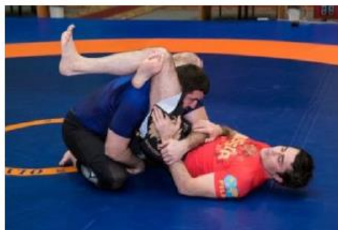
Оппонент защищается от обратного треугольника