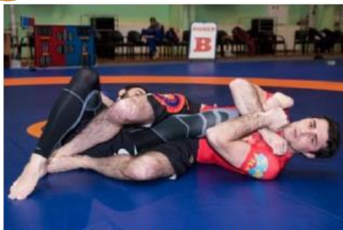
Рычаг колена на незащищенную ногу