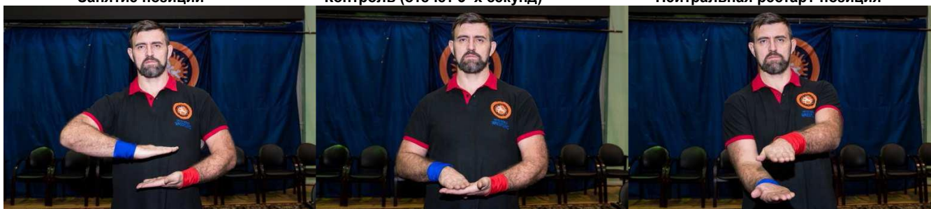
Рестарт-позиция закрытый гард