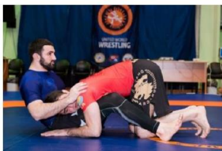
Спина ниже 90°