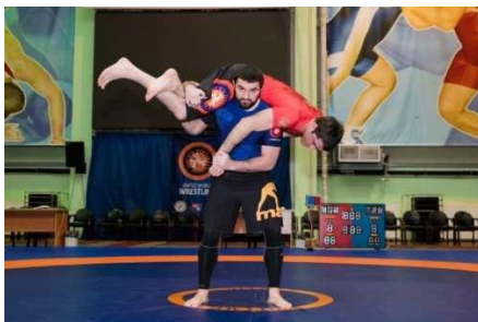
Пример 3-х очкового амплитудного тейкдауна (броска)

Бросок, при котором соперник падает на шею или голову, запрещен.