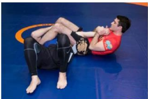
Рука выпрямлена более чем на 90°