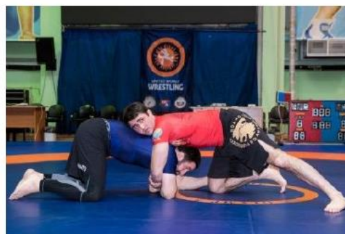
Спортсмены не проводят контроль за руками