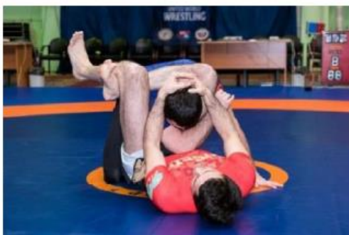
Плотно закрытый треугольник