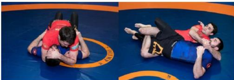
Скручивание шеи или замок со спины