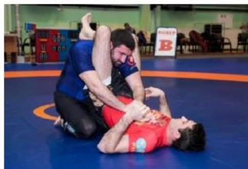
Нет плотно закрытого треугольника