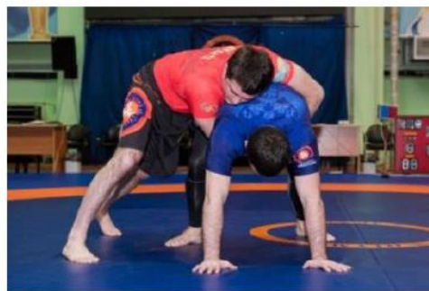
Нет 3 точки контакт и контроль между шей и руками