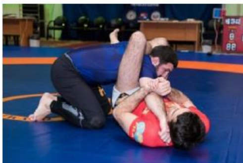
Обратный треугольник и атака на руку