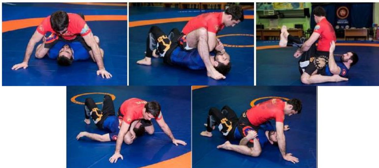
Пример позиций, где нет Full Mount

(2 руки под ногами; колено не на полу; лицом к ноге; треугольник; ног выше уровня подмышек)