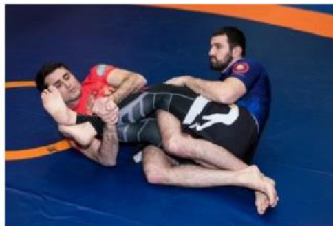
Рычаг колена на защищенную ногу